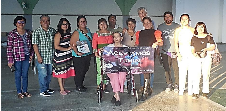
13° ANIVERSARIO DEL TÚMIN EN ESPINAL