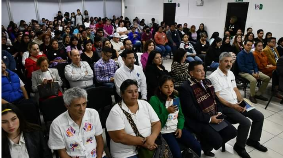
EL TÚMIN EN LA FACULTAD DE ADMINISTRACIÓN DE LA UV