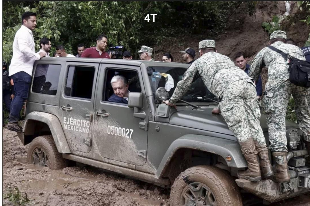
Sólo el ejército entregará despensas, nadie de la sociedad civil, afirmó AMLO

¿Que lo dijeron sus mentirosos adversarios?, en efecto, pero ¿cómo negar estos hechos? La verdad será siempre la verdad, no importa quién la diga. Y la mentira será mentira, aunque el fanatismo obnuble la razón que ve lo que no existe. ▀